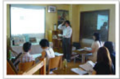
前回のセミナーの様子です。